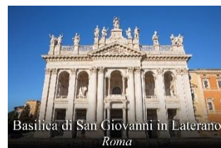
Basilica di San Giovanni in Laterano Roma

«Distruggete questo tempio e in tre giorni lo farò risorgere»... Ma egli parlava del tempio del suo corpo.